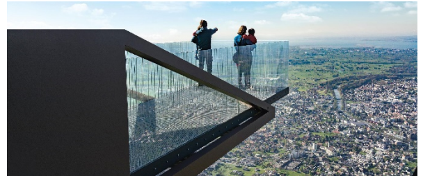
Das Ausflugslokal im Güttele