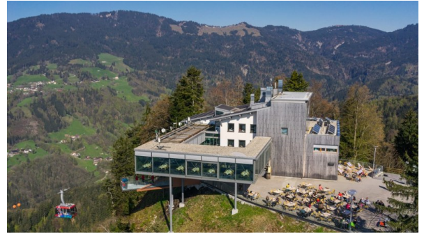
Der Karren mit herrlicher Aussicht

Hier stoßen dann die Wanderer durch die Rappenlochschlucht auf die Seilbahn-Fahrer. Ca. 18:00 Uhr Rückfahrt nach Bregenz ins Hotel. 19:00 Uhr Abendessen in Bregenz im Restaurant „ Kornmesser “ (Augustiner-Gaststätte direkt gegenüber vom Hotel mit Reservierung).