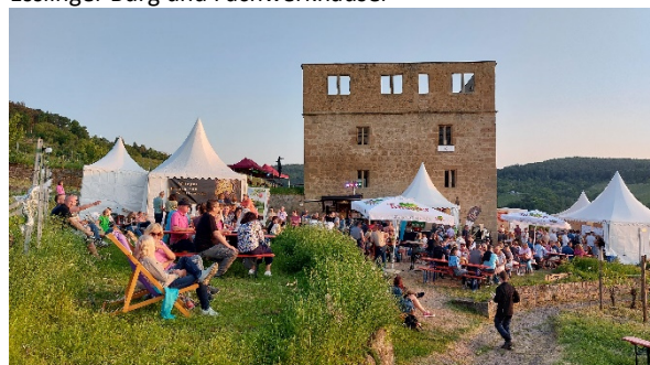
In den Stettener Weinbergen

Ca. 17:00 Uhr Weiterfahrt nach Wißgoldingen direkt auf das Musikfest (ein Stopp im Hotel ist aus organisatorischen Gründen leider nicht möglich).