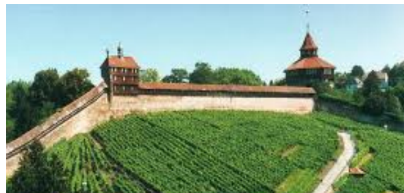
Esslinger Burg und Fachwerkhäuser

12:30 Uhr Mittagessen am Marktplatz (ohne Reservierung – jeder selbstständig).