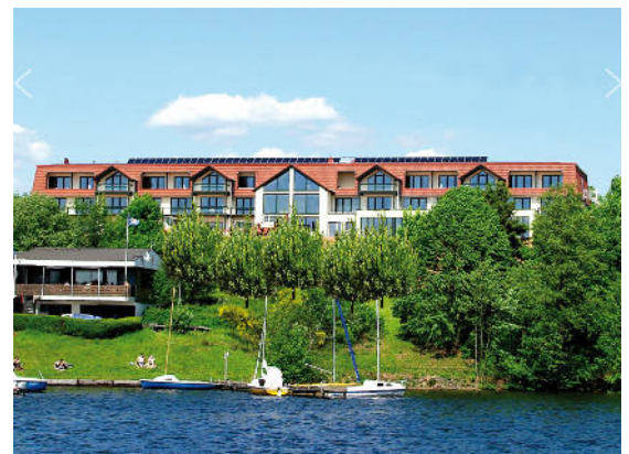
Zum Stausee 192, 66679 Losheim am See Tel.: (06872) 9692-0 www.hochwaelder-wohlfuehlhotel.de