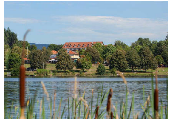
Zum Stausee 202, 66679 Losheim am See Tel.: (06872) 6008-0 www.seehotel-losheim.de